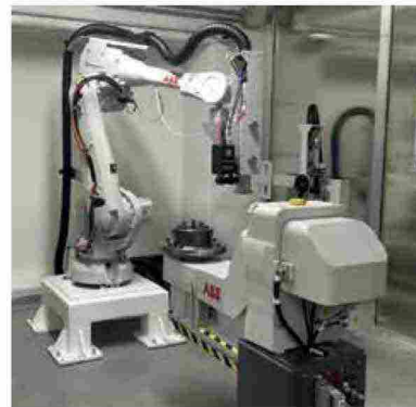
La cella robotizzata per la tempra laser installata presso Nextema

Nata nei primi anni 80, Teicos si occupa a tutto tondo di integrazione di sistemi, soprattutto in ambito di networking, con soluzioni che sono sviluppate secondo i paradigmi di Industria 4.0 favorendo la connessione, la comunicazione, l'automazione e il controllo tra