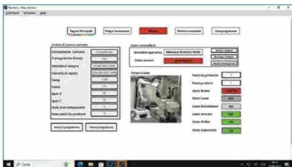
Ignition è l'orchestratore dell'intero sistema cella