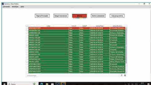
L'intervento operato da Teicos ha riguardato anche la teleassistenza