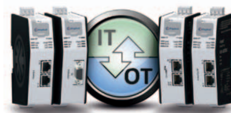
I gateway Anybus .net di HMS Industrial Networks

HMS Industrial Networks era presente a Norimberga con il suo nuovo gateway e router per l'accesso remoto eWon Flexy 205 . Le soluzioni per il controllo da remoto di dispositivi industriali eWon di HMS sono commercializzate in Italia attraverso la sua filiale e con la collaborazione di EFA Automazione , che è distributore unico nazionale. Specificamente progettato per soddisfare le esigenze dei costruttori di macchine, eWon Flexy 205 è un gateway, adatto a supportare la connettività della Industrial Internet of