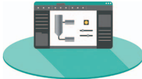
Crew 2.0, lo Scada di ESA Automation, è stato estesamente rivisto nel layout e dotato di una grafica più chiara ed accattivante

Oltre alle novità software, ESA Automation ha