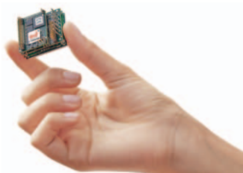
Il servo-azionamento Gold Twitter ha dimensioni estremamente ridotte e un'alta densità di potenza

azionamento, Elmo ha anche derivato un drive di potenza addirittura doppia rispetto ai già notevoli livelli di Gold Twitter: con un peso di soli 33 grammi e correnti/tensioni di 160 A/80 V e 140 A/100 V, il nuovo Double Gold Twitter eroga oltre 10 kW di potenza (pure power), rappresentando la soluzione ideale per applicazioni che richie-