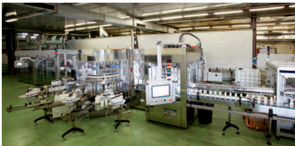
Il gruppo Fameccanica produce anche macchine per il packaging e per il riempimento di bottiglie (shampoo, balsamo ecc.)

Il sistema di acquisizione dati e controllo progettato dal Dipartimento Automation & Control di Fameccanica è stato pensato per consentire ai clienti di consultare i dati relativi al funzionamento delle macchine e alla produzione sia localmente sia da remoto, da PC o tablet, nel rispetto delle proprie politiche di protezione dei dati aziendali. L'architettura richiesta era di tipo scalabile, predisposta per l'implementazione di funzionalità aggiuntive, nonché di personalizzazioni atte a soddisfare le esigenze che potrebbero emergere lato cliente. Inoltre fattore di fondamentale importanza, doveva essere semplice da usare. Tra le funzionalità richieste, dovevano essere presenti gli indicatori di performance (per un controllo immediato dello stato del sistema), i dati di produzione divisi per singoli cicli o turni, ed era necessaria la compilazione di statistiche sulle cause del fermo macchina, sulle ragioni di scarto e sul consumo di materie prime. Nella versione precedente, il sistema era stato realizzato