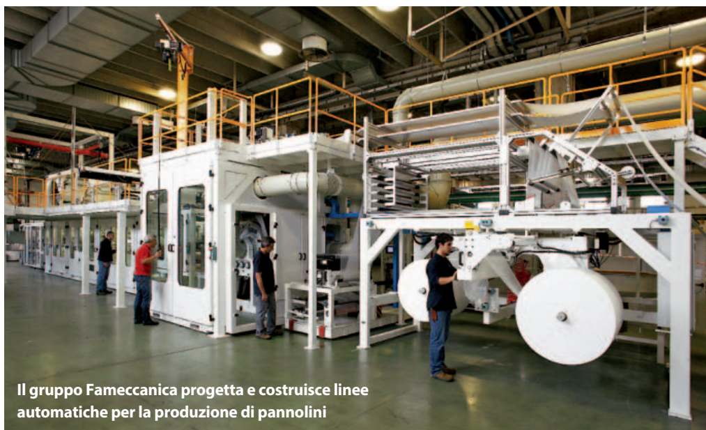
Il gruppo Fameccanica progetta e costruisce linee automatiche per la produzione di pannolini

Fameccanica ha utilizzato il software HMI-Scada-MES Ignition di Inductive Automation che in Italia è distribuito da EFA Automazione. Tramite Ignition è stato possibile realizzare sia la parte di raccolta dati, grazie alla parte di OPC server, sia il client per la visualizzazione e analisi dei dati, impiegando un comune PC industriale con vantaggi in termini di scalabilità e flessibilità. Inoltre, la precedente struttura del database è stata preservata, consentendone al contempo una gestione più efficace grazie alla possibilità di programmare in Ignition le più svariate operazioni mediante l'uso di appositi script e la disponibilità di librerie contenenti diverse funzioni. L'interfaccia utente è stata resa di più facile utilizzo, fruibile sia da PC sia da dispositivi mobili grazie alle funzioni programmabili per il ridimensionamento e riposizionamento automatico